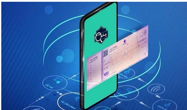
چک الکترونیک در یک گوشی هوشمند